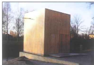
Den interaktiva konstpaviljongen "Lux"

Konstnär och projektansvarig: Stefan Rydén